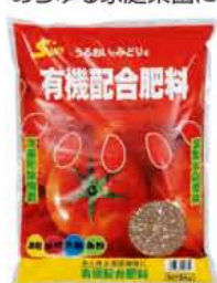
有機配合肥料 5kg 油粕・骨粉・米糠・魚粉