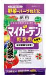
マイガーデン 野菜用肥料 1kg