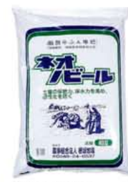
牛ふん堆肥 ネオノビール 40ℓ