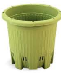
楽々菜園プランター 丸形 380 直径 395 × 高さ 353mm