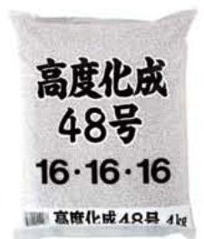
高度化成 48 号 4kg・20kg