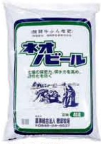
牛ふん堆肥 ネオノビール 40ℓ