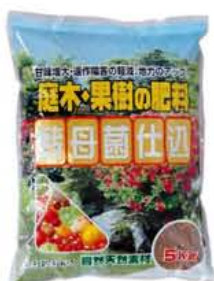
庭木・果樹の肥料 5kg