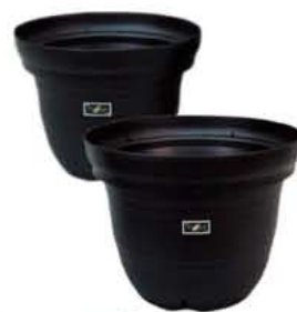
ツリーポット ブラック 450型 約直径45×高さ35cm 540型 約直径54×高さ42cm